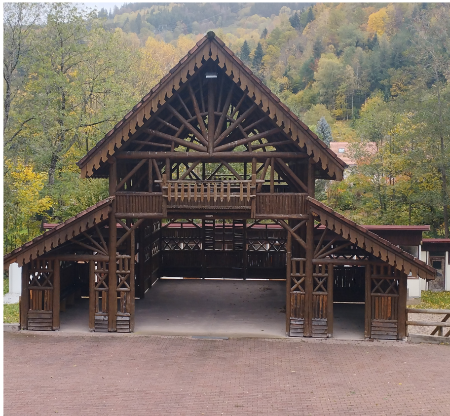
Le Théâtre de Verdure