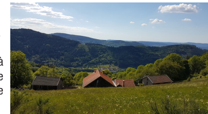
Vue sur les vallées de la Haute-Meurthe