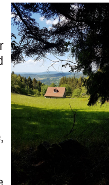
La maison Cleuvenot