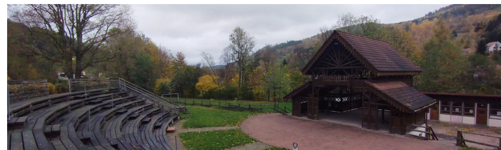
Le Théâtre de verdure