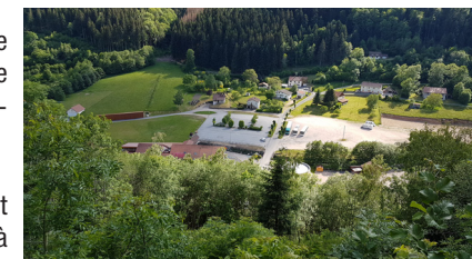
Vue sur le site de la confiserie CDHV