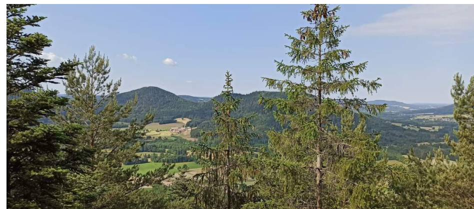
Vue sur les monts Thirville et Moyennel à la roche des Fées