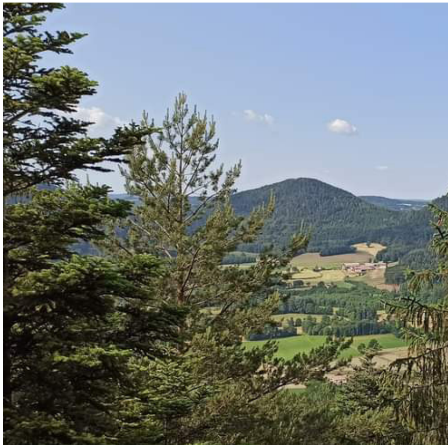
Le Mont Thirville et le col de la Gueule du Loup

Ce document est exclusivement réservé à une utilisation individuelle en accompagnement d'un parcours numérique - Toute autre reproduction interdite