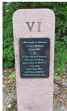
La Borne VI

Cette borne entretient la mémoire de la lutte héroïque d'un bataillon américain encerclé par l'armée Allemande. Le 24 octobre 1944, une attaque surprise de 700 Allemands coupe ce bataillon et encercle 252 soldats texans dans une situation critique sans eau, ni vivres et peu de munitions. Les Américains (les NISEI) s'engagent dans une bataille en 4 jours pour sauver ce bataillon, au prix de nombreuses vies humaines.