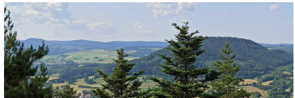
La Roche des Fées

Comité des Vosges FFRandonnée : 06 61 69 69 35.