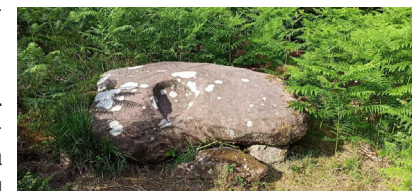
La Pierre de la Guillotine