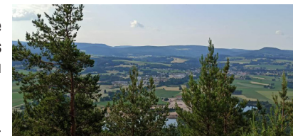
La Roche du Corbeau

9 Prendre à gauche, le chemin qui conduit au village puis à gauche pour rejoindre le parking.