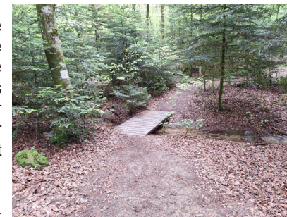
Passerelle sur le parcours

3 Traverser le petit ruisseau, suivre le sentier jusqu'au panneau pédagogique "la forêt et les hommes". Entrer dans le labyrinthe éducatif végétal pour y découvrir toute sa richesse. Retour au parking.