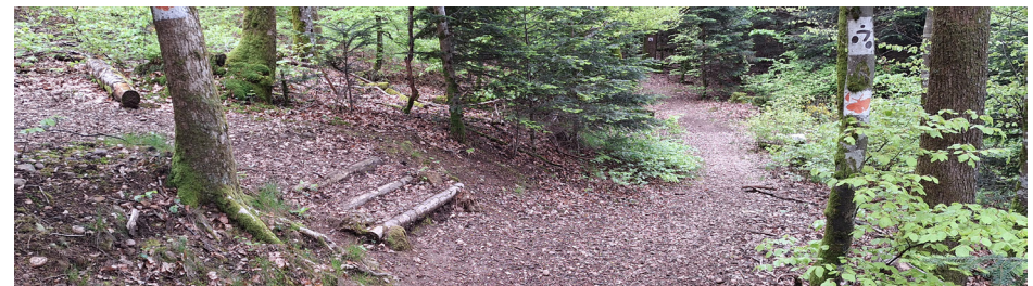
Panneau départ itinéraire le Nacré