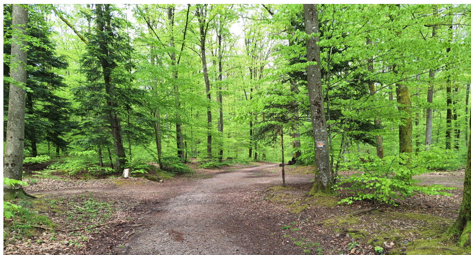
Sentier sur le premier tronçon

1 Depuis le panneau de départ avancer 100 m sur le chemin pour trouver le balisage (le papillon couleur orangé sur fond blanc peint sur les arbres) puis suivre ce balisage en prenant le sentier qui descend par la droite. Un peu plus bas possibilité de faire un A/R sur la droite pour découvrir une source captée. Continuer par la gauche pour découvrir un panneau pédagogique "Au fil de l'eau" Franchir le petit pont et continuer jusqu'à la tourbière.