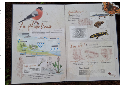
panneau pédagogique le fil de l'eau