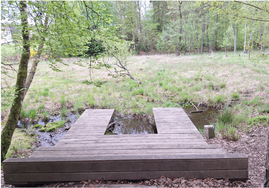
Pontons sur la tourbière