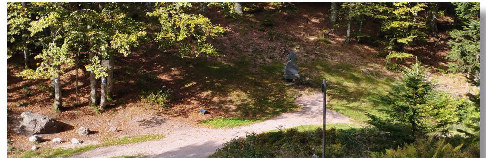
La Stèle au Collet Mansuy