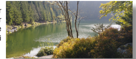
Le lac des Corbeaux

7 Continuer la piste à gauche, traverser la route, passer à gauche du parking puis prendre le sentier sur la gauche. Traverser la route du Lac et prendre le sentier bien sur la gauche. Couper une seconde fois la route et descendre en face jusqu'au parking de départ.