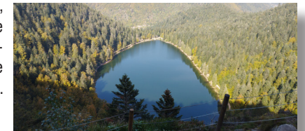
Vue de la Roche du Lac