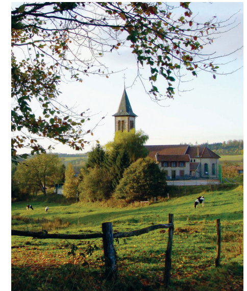
Église de Saint-Benoît-la-Chipotte

RFN8802-03 - Le nom RandoFiche® est une marque déposée, nul ne peut l'utiliser sans l'autorisation de la FFRandonnée. © FFRandonnée 2021.