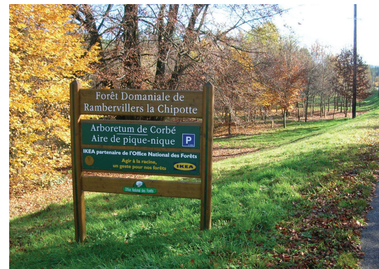
Arboretum de Corbé