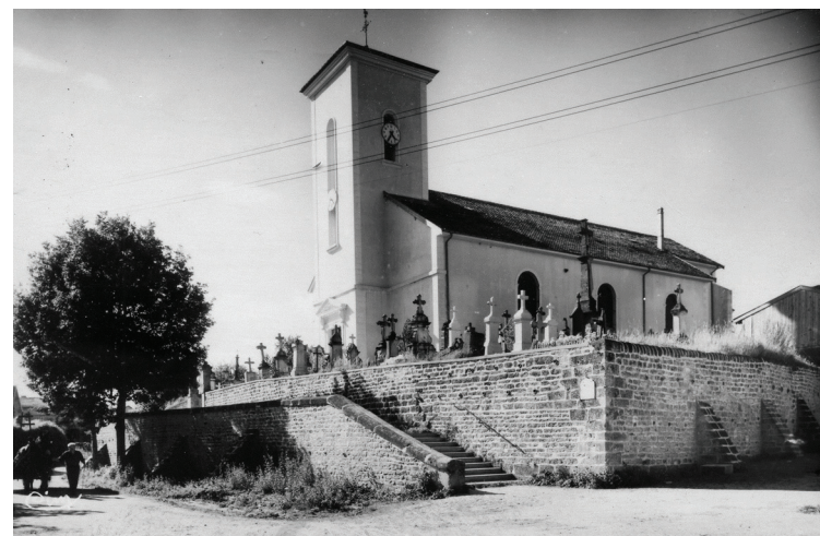
© Marc Masson / Groupe Cartophile

(qui représente la terre de Lorraine), est coupé d'une bande bleue symbolisant le Monseigneur, cours d'eau qui traverse le village. Les trois arbres présents symbolisent quant à eux la victoire de 1918, le chêne représente la commune, les sapins la Lorraine et l'Alsace ; les véritables arbres, détruits pendant la tempête de 1999, avaient été plantés devant l'église.