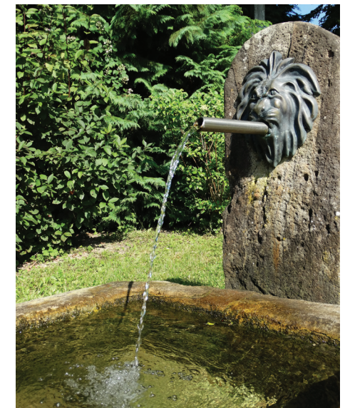
Fontaine au Lion, à Brû