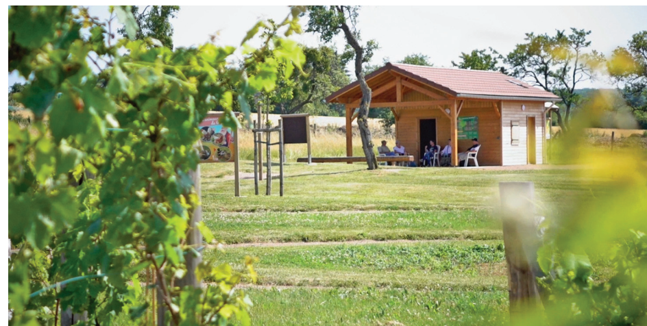
Verger conservatoire de Bult

2 Continuer tout droit dans la rue de l'Église [👁 > église]. Plus loin, tourner à droite pour retrouver la mairie-école et le point de départ.