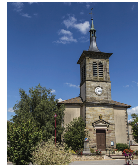
Église de Bult