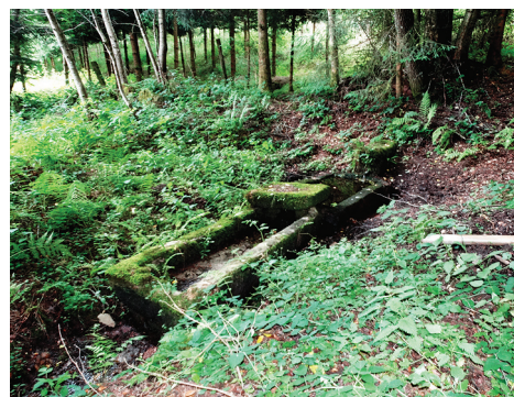
Fontaine dans la forêt