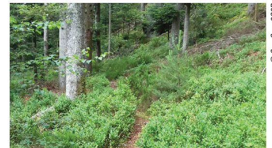
Sentier des myrtilles

Hébergements Pensez à réserver ! Hôtels, gîtes, chambres d'hôtes, meublés... : renseignements au syndicat d'initiative de Rambervillers