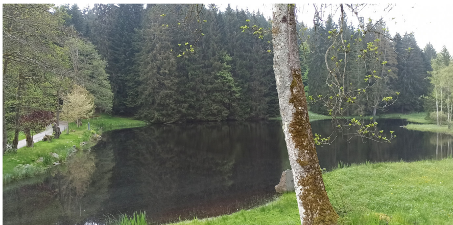
Etang de la chapelle Sainte-Anne