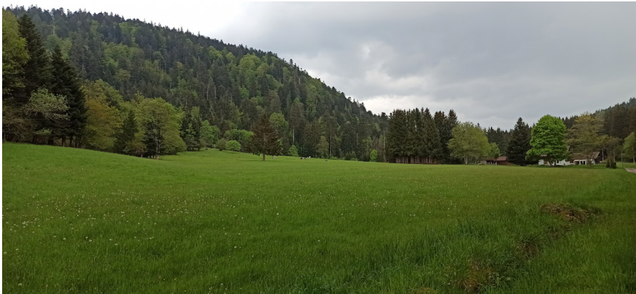
La Basse de Martimpré