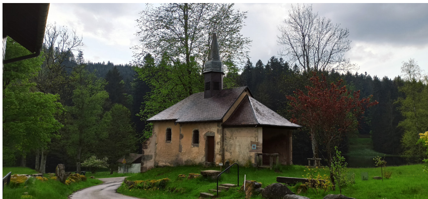
La chapelle Sainte-Anne