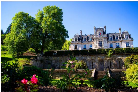
Le château des Brasseurs