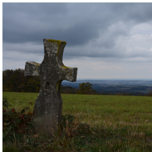
La croix du Boubot.